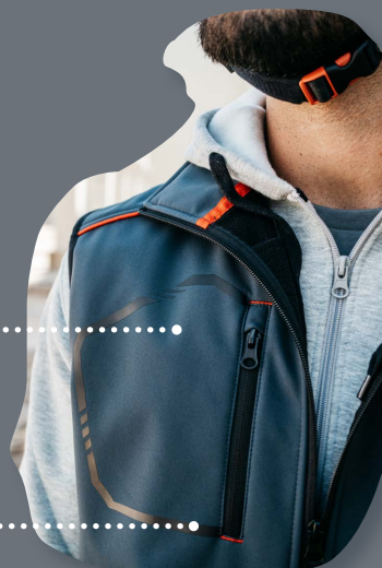
2 bolsillos interiores