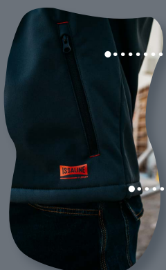
Hecho de material reciclado