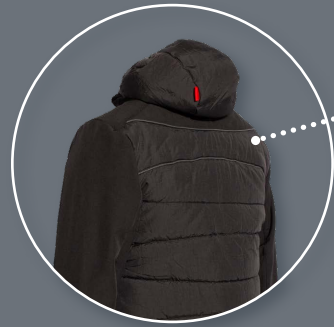
Tiras reflectantes en la parte alta de la espalda