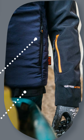
Cordón ajustable en el bajo de la chaqueta